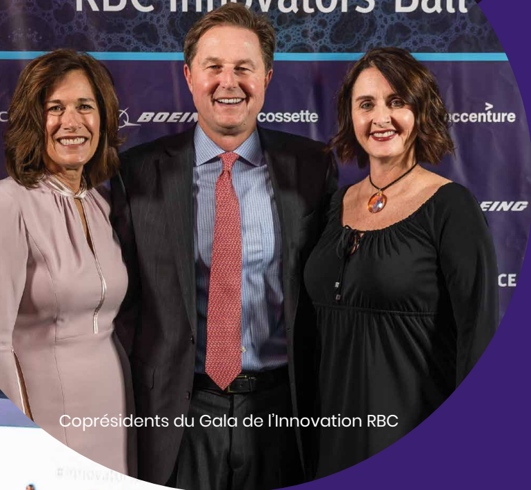
Coprésidents du Gala de l'Innovation RBC